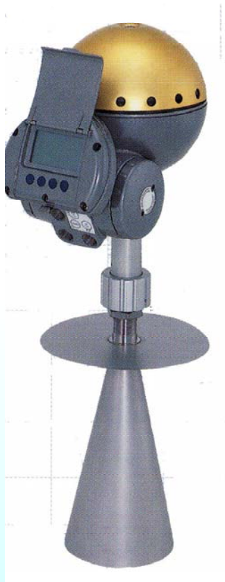
パラボラアンテナ仕様(表示器あり)